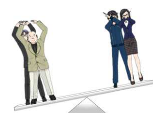
会社の支援から経済を重視した公約