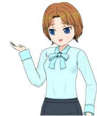
総務省×鷹の爪団「選挙はマナーだ!」篇 Youtube